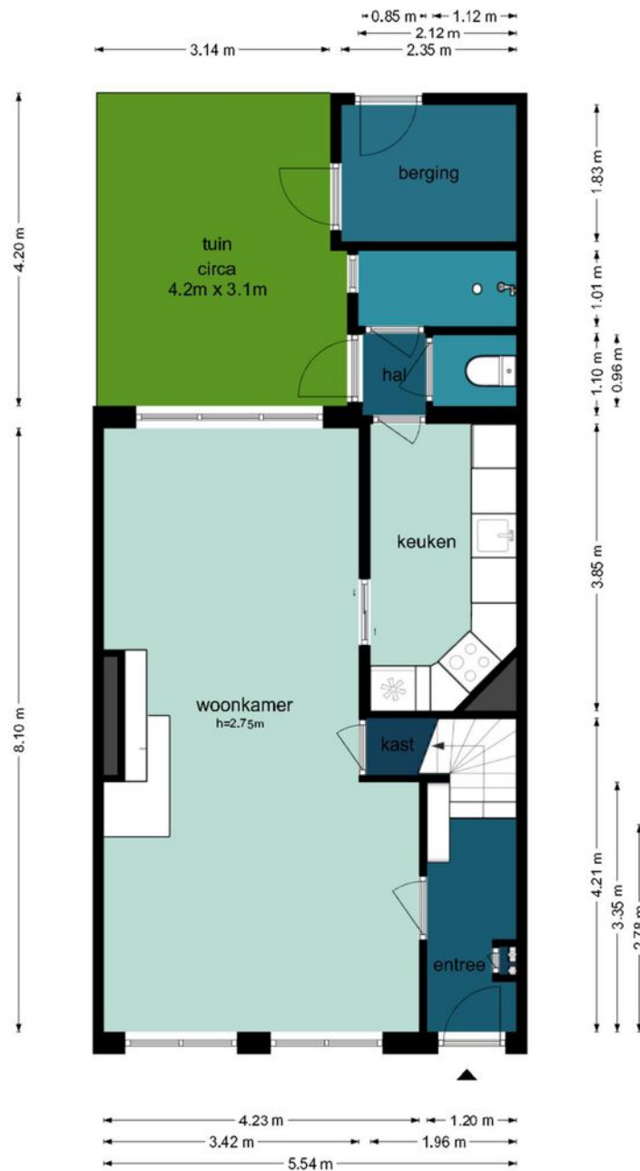
Achtermeulen 5 - Bussum Begane Grond

De plattegronden zijn geproduceerd voor promotionele doeleinden en ter indicatie. Aan de plattegronden kunnen geen rechten worden ontleend.