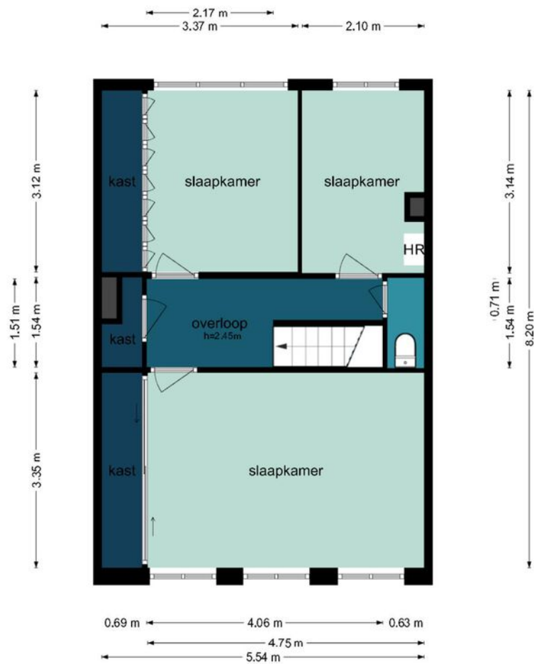
Achtermeulen 5 - Bussum Eerste Verdieping

De plattegronden zijn geproduceerd voor promotionele doeleinden en ter indicatie. Aan de plattegronden kunnen geen rechten worden ontleend.