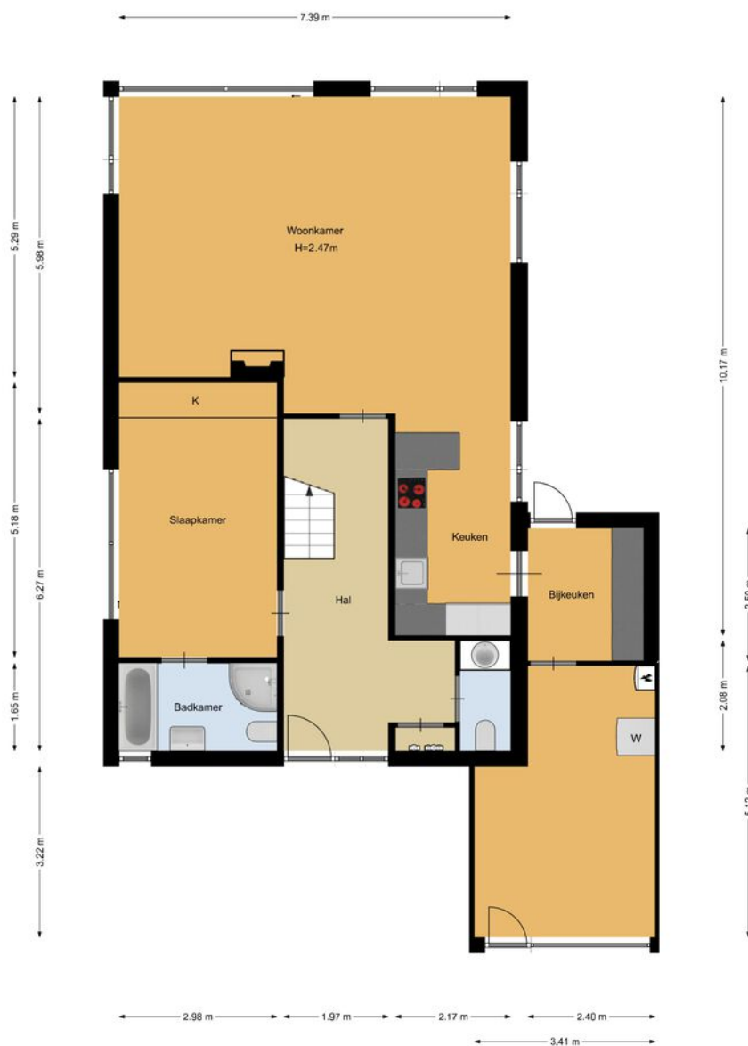
Walgang 5, Naarden Begane grond

De plattegronden zijn geproduceerd voor promotionele doeleinden en ter indicatie. Aan de plattegronden kunnen geen rechten worden ontleend.