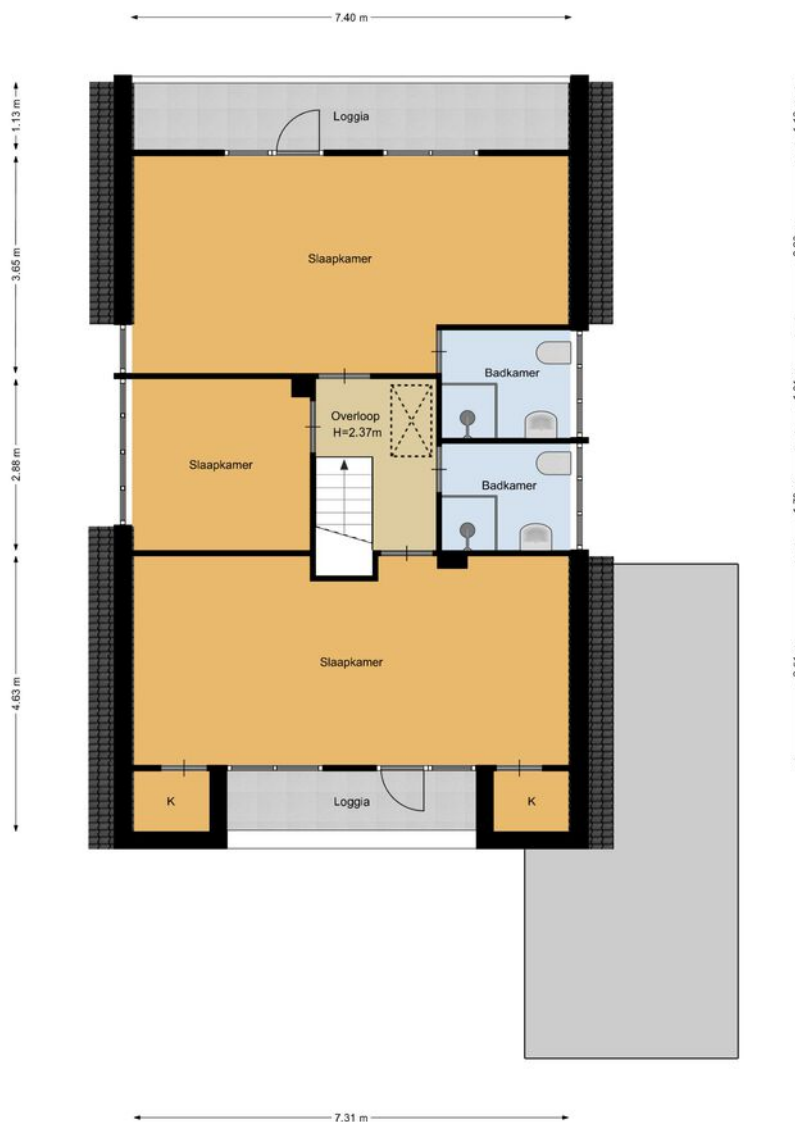
Walgang 5, Naarden 1e verdieping

De plattegronden zijn geproduceerd voor promotionele doeleinden en ter indicatie. Aan de plattegronden kunnen geen rechten worden ontleend.