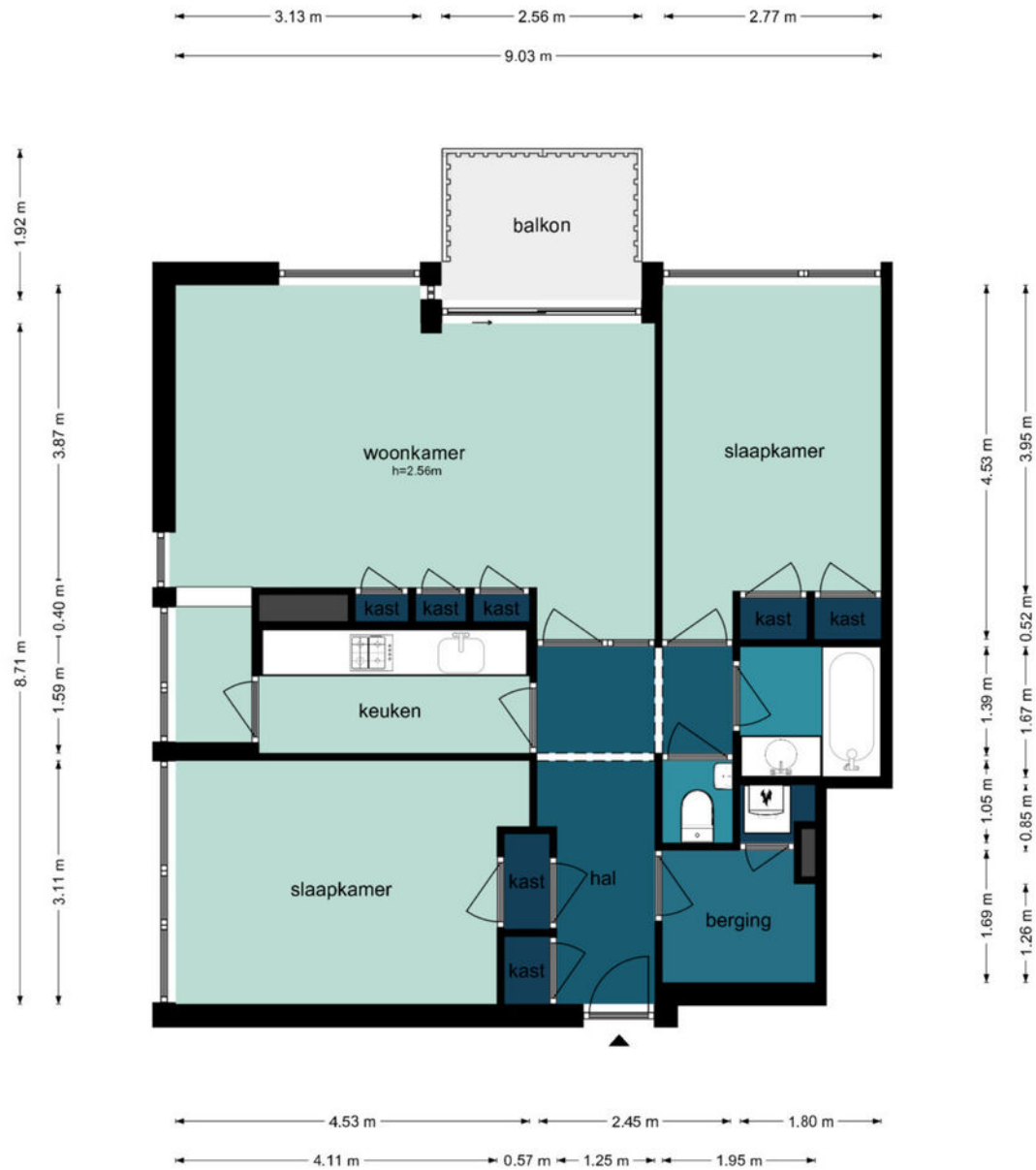
Graaf Willem de Oudelaan 95 - Naarden Eerste Verdieping

De plattegronden zijn geproduceerd voor promotionele doeleinden en ter indicatie. Aan de plattegronden kunnen geen rechten worden ontleend.