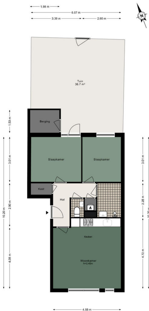
Naardingerland 106 - Huizen Begane grond

De plattegronden zijn geproduceerd voor promotionele doeleinden en ter indicatie. Aan de plattegronden kunnen geen rechten worden ontleend.